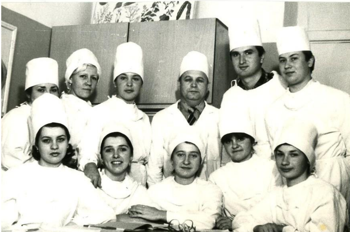
1987 год. Ассистент, к. мед. н. кафедры акушерства и гинекологии Ворошиловградского медицинского института среди субординаторов акушеров-гинекологов.